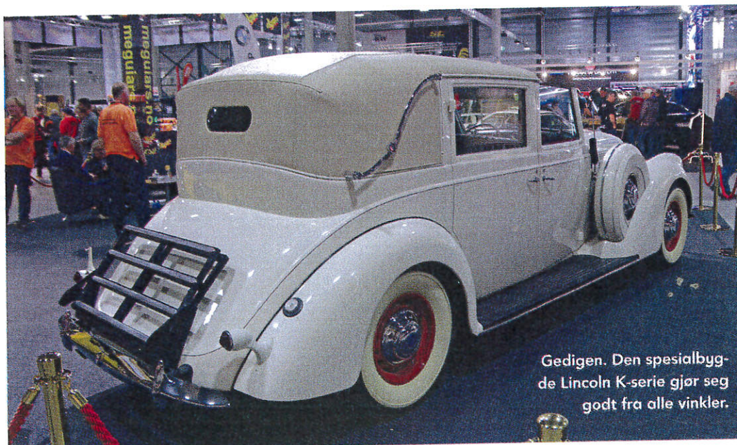
Gedigen. Den spesialbygde Lincoln K-serie gjør seg godt fra alle vinkler.

I mellomtiden er det bare å prøve å følge alle spor av disse tilbehørene som måtte dukke opp, og med denne etterlysningen er det kanskje en mulighet for at letingen kan bli mer finkjemmet, for mye skulle forbause oss om ikke en eller annen av leserne vet mer ... ☺