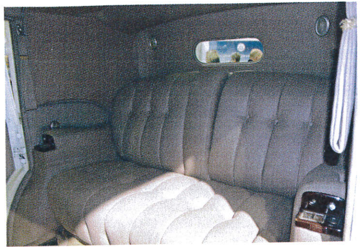
Møblert. Men hvor har det blitt av klappstolene og det spesielle barskapet som tilhører bilen?

Stormbringer så straks åpningen, og heldigvis ble knuten løst i den beste forståelse hos begge parter. Ikke bare det, men Stormbringer sørget også for en umiddelbar finansiering i museets navn slik at kjøpet kunne landes kjapt og trygt.